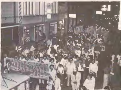
Miles y miles di persona a tumu parti na e marcha di libertad na aña 1975.

1952 ela asisti na Ronde Tafel Conferentie na Den Haag como miembro di e delegacion Antillano. Door di su esfuerso ela hunga un rol grandi den realisacion di nos "Eilandenregeling (ERNA)", loke ela considera solamente como un paso pa autonomia completo di Aruba.